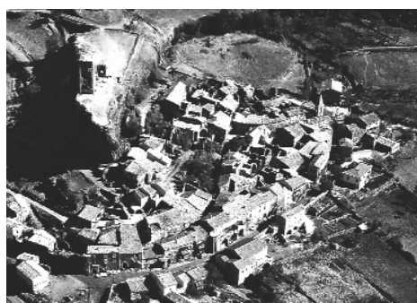
Vue d'ensemble village et château

Les études dont cet ensemble castral a fait l'objet, souvent ponctuelles, parfois très fines, sont nombreuses mais fréquemment dispersées dans des publications devenues maintenant peu accessibles et dont l'existence reste parfois méconnue d'un large public.